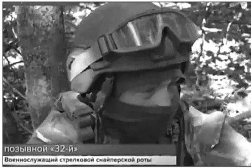
Позывной «32-й» Военнослужащий стрелковой снайперской роты

Ребята знают, что даже одним выстрелом можно спасти десятки жизней своих боевых товарищей. Наш земляк – военнослужащий стрелковой снайперской роты и выполняет задачи в Запорожской области.